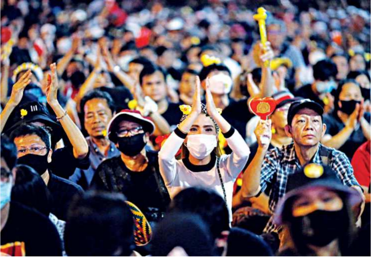
Pro-democracy activists protest after the constitutional court's ruling on Prime Minister Prayut Chan-O-cha's conflict of interest case, in Bangkok, Thailand, yesterday.

The main opposition party Pheu Thai brought the legal challenge, which if it had succeeded would have forced Prayut and his cabinet out of office.