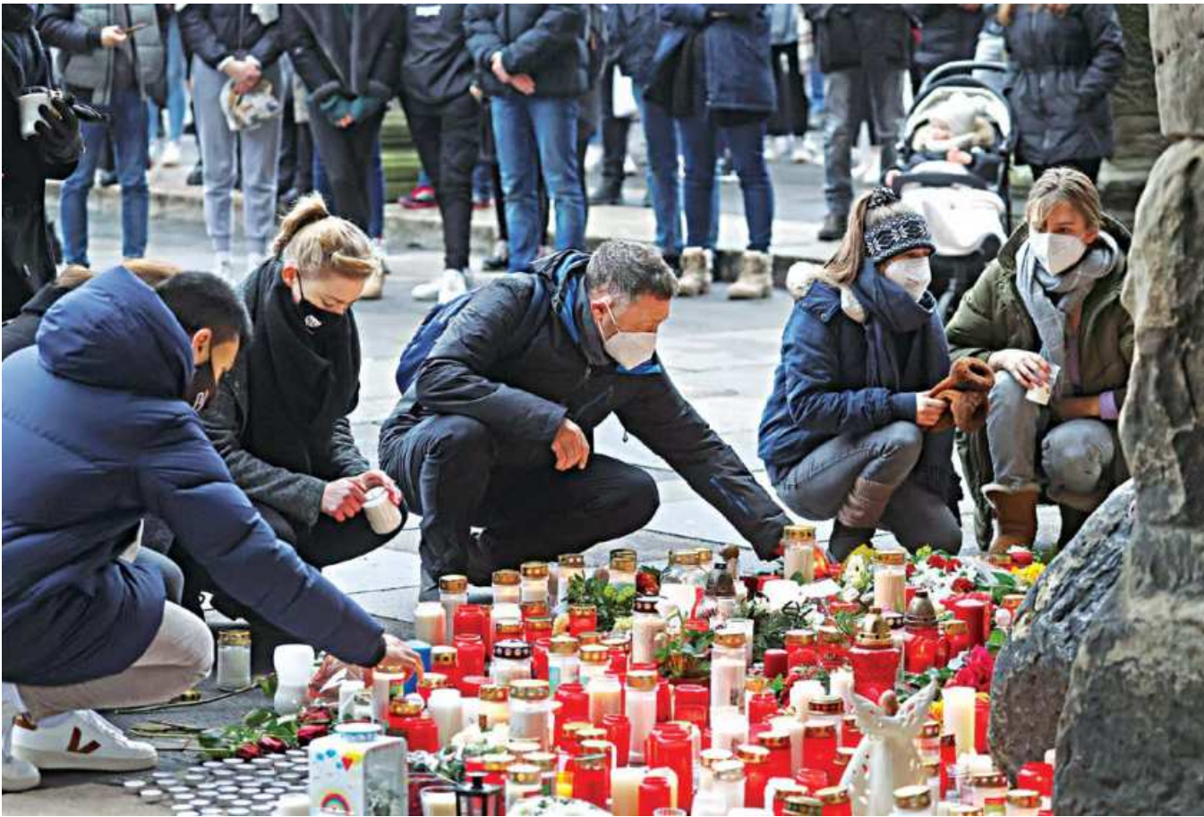
People pay their respects at the site where a car crashed into pedestrians in Trier, yesterday. Five people including a nine-week-old baby were killed and up to 15 injured on Tuesday when a speeding car ploughed into a pedestrian area in the western German city of Trier. Prosecutor Peter Fritzen later told a news conference the suspect had drunk a significant amount of alcohol, and authorities were not working on the assumption that there was any Islamist militant motive to the incident.

But the finance hub remains deeply polarised with many still seething against Beijing's growing hold on the semi-autonomous city.