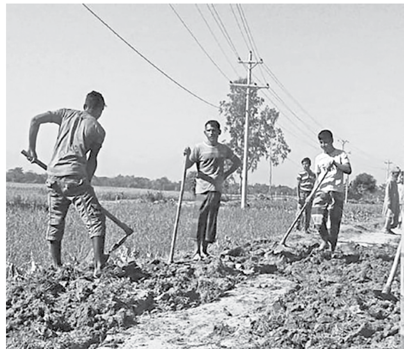
A few of the villagers, young and old, who joined hands to repair the two-kilometre-long dirt road in Shukurullahgaon village of Moulvibazar's Kamalganj upazila.

The makeshift repair work on the dirt road will last only till the next monsoon and the authorities should take immediate steps to pave it before the monsoon arrives, the villagers