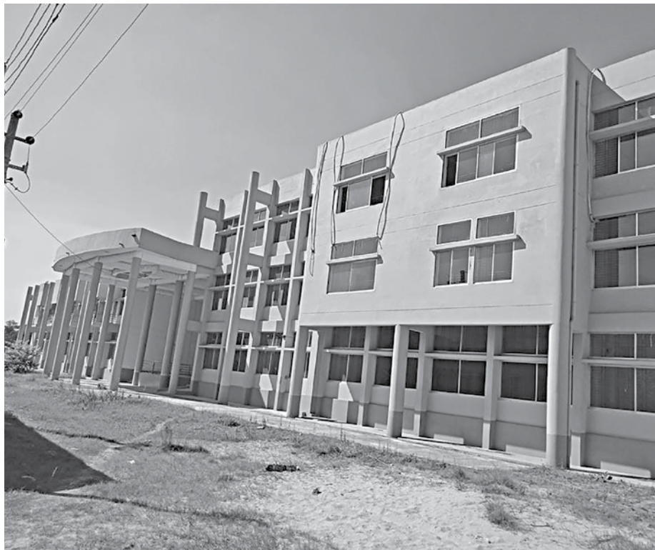
The nursing institute in Pabna town is yet to be opened, two years into building.

According to the district health department and Pabna Diabetic Association, although construction of the nursing institute was completed in 2018, the building is still awaiting its