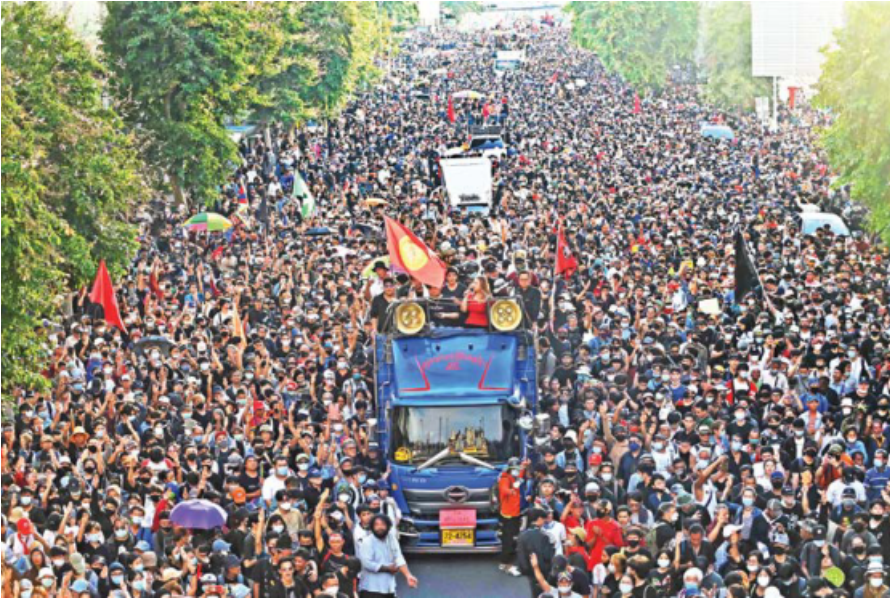
Student leaders, boarded on a truck, lead a procession as pro-democracy protesters march towards the Government House during an anti-government rally in Bangkok, yesterday.

"They must not touch the institution," he told reporters.