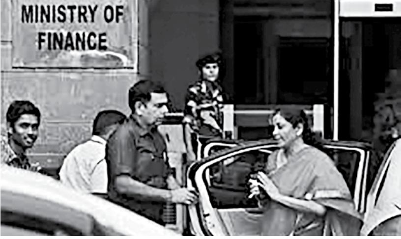
Finance Minister Nirmala Sitharaman arrives at her office before leaving for parliament to present the federal budget in New Delhi, India.

The government will allow its employees to spend tax-exempt travel allowances on goods and services, Nirmala Sitharaman, India's finance minister told a news briefing. She said the government will also shore up investment by spending extra 250 billion rupees ($3.41 billion) on roads, ports and defence projects, and offering 120 billion rupees in interest-free 50-year loans to state governments for spending on infrastructure before March 31, 2021. "All these measures are likely to create an additional demand of 730 billion rupees ($9.96 billion)," Sitharaman said, adding the proposals would stimulate demand in a "fiscally prudent way." Prime Minister Narendra Modi's government, which imposed a tough lockdown to stem the spread of the coronavirus in March, is pushing ahead with a full opening to try to boost the economy ahead of the