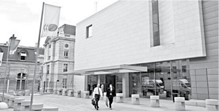
Outside view of the Organization for Economic Co-operation and Development headquarters in Paris.

The global economy could shed more than 1 per cent of output if international talks to rewrite cross-border tax rules break down and trigger a trade war, the OECD said on Monday, after countries agreed to keep up negotiating to mid-2021. Nearly 140 countries agreed on Friday to extend talks after the pandemic outbreak and US hesitation before the presidential election squashed hopes of reaching a deal this year. Public pressure is growing on big, profitable multinationals to pay their share under international tax rules after the COVID-19 pandemic strained national budgets, the countries said in an agreed statement. The aim is update international tax rules for the age of digital commerce, in particular to discourage big Internet companies