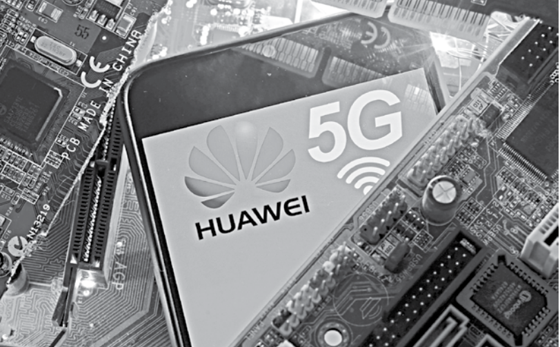
A smartphone with the Huawei and 5G network logos is seen on a PC motherboard in this illustration picture.

the Chinese firm from supplying key telecoms equipment, Orange and Proximus last week picked Nokia to help build 5G networks in Belgium. EU members have been stepping up scrutiny of so-called high-risk vendors. This subjects Huawei's governance and technology to critical examination and is likely to lead other European operators to strip it from their networks, analysts say.