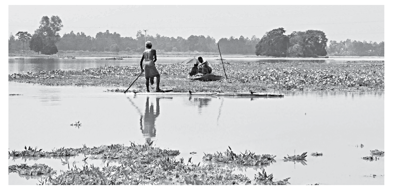
Water level of the Jamuna river has increased, flooding most of the low lying areas of Tangail's Basail upazila.