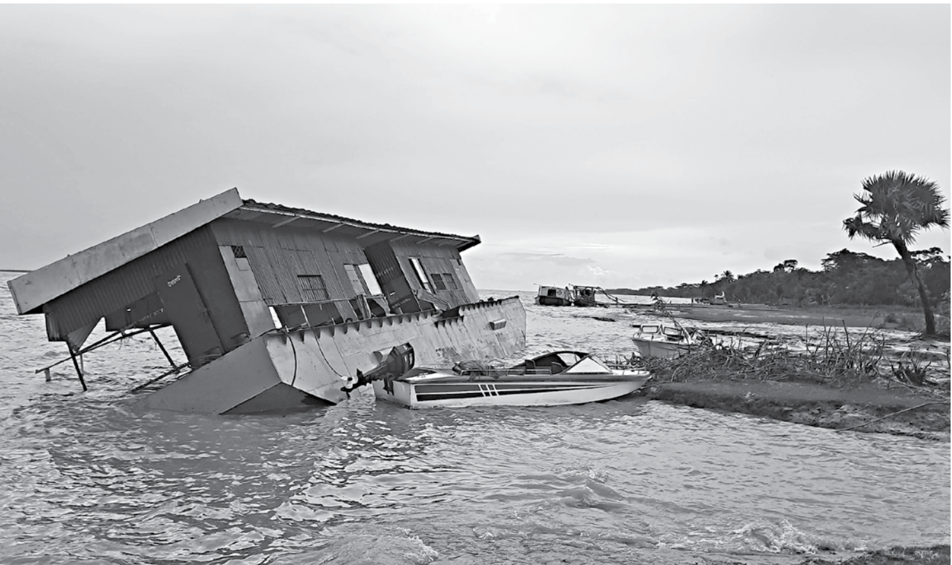
The pontoon at Auliapur launch terminal in Patuakhali's Dashmina upazila has been lying unused since the coastal district was hit by cyclone Amphan on May 19 this year.

He further added that the local administration has been asked to provide all kinds of assistance from their side till the situation returns to normal.