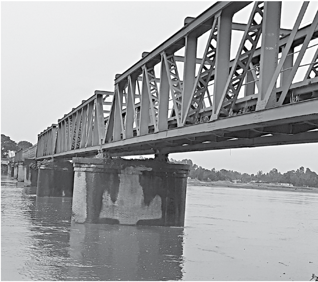
The British-era Sonahat iron bridge, on the Dudhkumar river in Kurigram's Bhurungamari upazila, was supposed to go out of service in 2001. But without a replacement bridge, it is still in service.