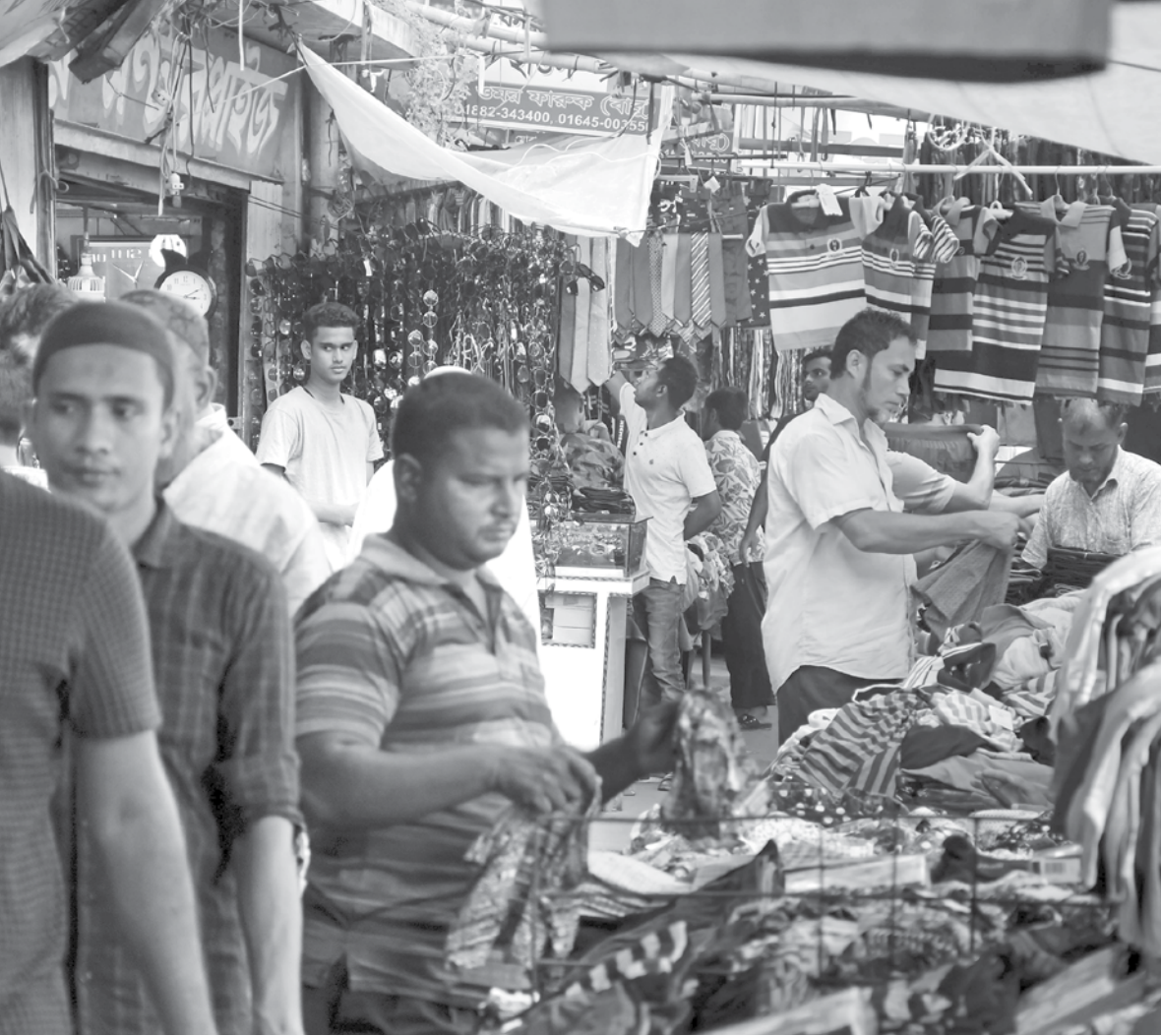
As life returns to normal cadence after months of slowdown, this footpath in the capital's Gulistan is also returning to a familiar scene. Roadside hawkers have come back to the streets with their makeshift shops, taking up the footpath and leaving not nearly enough space for pedestrians to walk at a safe distance apart from each other. Face masks are also vanishing fast from sight, although the rate of Covid-19 infection has not shown much of a sign of easing up. The photo was taken on Friday.