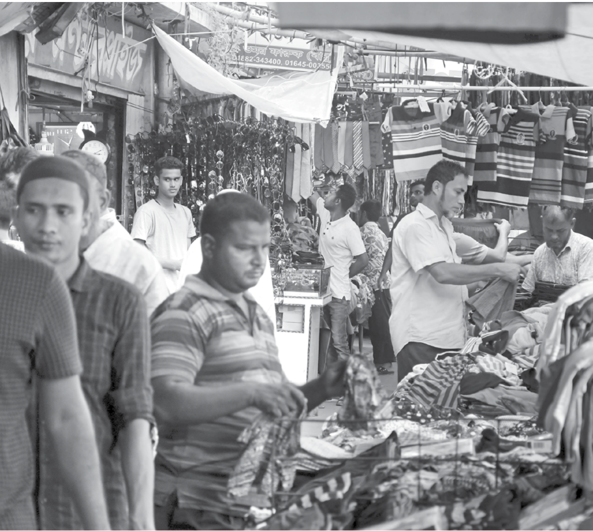
As life returns to normal cadence after months of slowdown, this footpath in the capital's Gulistan is also returning to a familiar scene. Roadside hawkers have come back to the streets with their makeshift shops, taking up the footpath and leaving not nearly enough space for pedestrians to walk at a safe distance apart from each other. Face masks are also vanishing fast from sight, although the rate of Covid-19 infection has not shown much of a sign of easing up. The photo was taken on Friday.