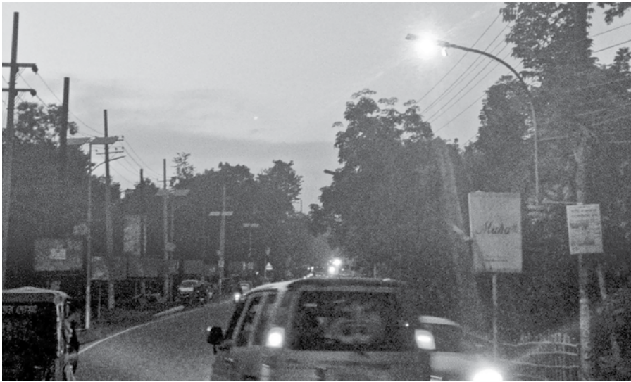
This road from MAG Osmani International Airport to Sylhet city has had most of its solar-based lights out of order for months. After 9pm, hundreds of trucks ply this road, whose bright headlights put smaller vehicles coming from the other side in danger.

Describing the Digital Security Act as a "dogmatic" law, he said it cannot exist in any civilised society or in any civilised welfare state. "It's an unconstitutional law. We demand immediate repeal of this law."