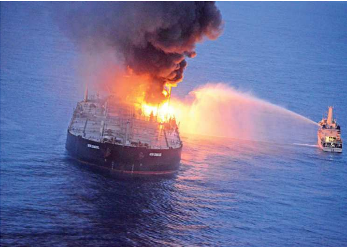
A Sri Lankan Navy boat sprays water on a supertanker after a fire broke out off east coast of Sri Lanka, yesterday. A senior Sri Lankan navy official yesterday said there is no real danger of an oil spill from the stricken supertanker MT New Diamond, which caught fire in the seas off the island nation on Thursday. The tanker, chartered by Indian Oil Corp (IOC), is carrying 270,000 tonnes of crude and 1,700 tonnes of diesel. There were 23 crew on board, one of whom is presumed dead. The rest have been taken off the ship by the Sri Lankan navy.