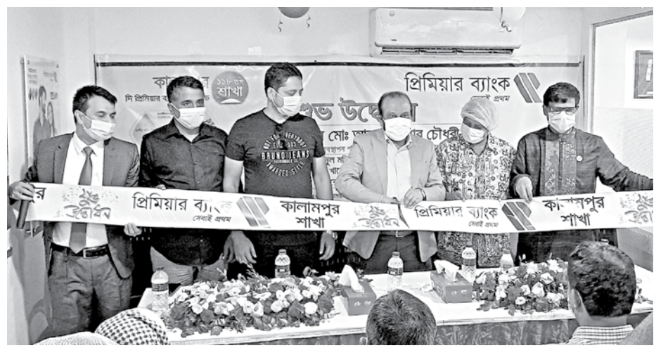
Additional Managing Director of Premier Bank opens the bank's Kalampur branch at Dhamrai in Savar recently.

"It is not difficult to verify if a trader gives wrong information in the import documents."