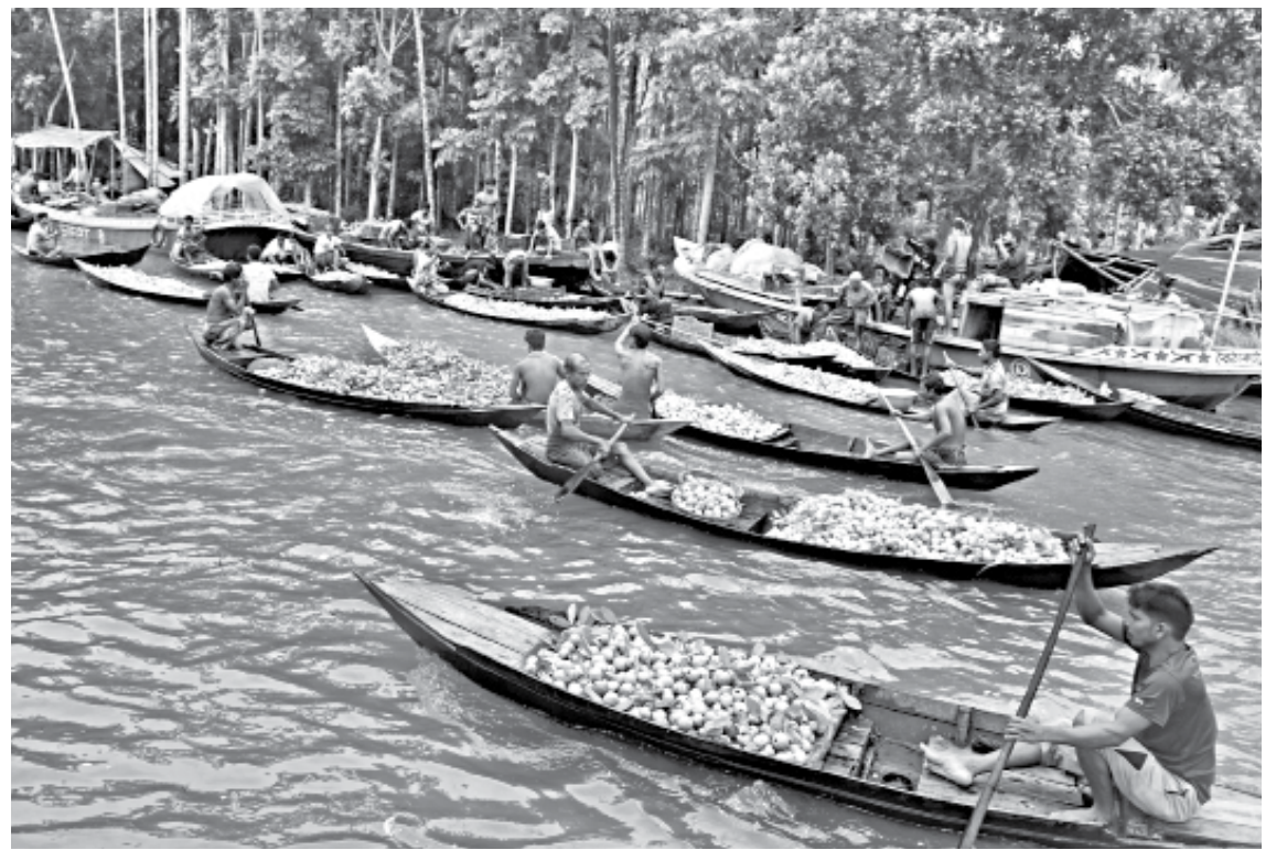
The floating guava market at Bhimruli in Jhalakathi Sadar upazila.

Pabitra Mandal of Shatadashkathi village in Jhalakathi