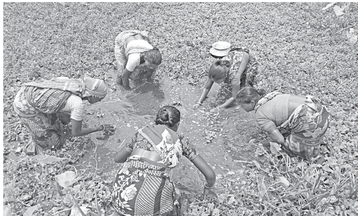
A group of women from the ethnic community are seen busy catching fish at a roadside ditch in Shantinagar area of Joypurhat Sadar upazila. The photo was taken a few days ago.

Upazila Nirbahi Officer Monira Parveen said strict action will be taken after investigating the matter.