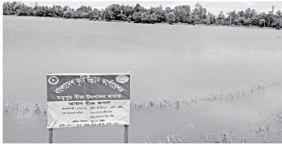
The Seed Production Farm set up by BADC in Tangail's Madhupur upazila have gone under floodwaters.