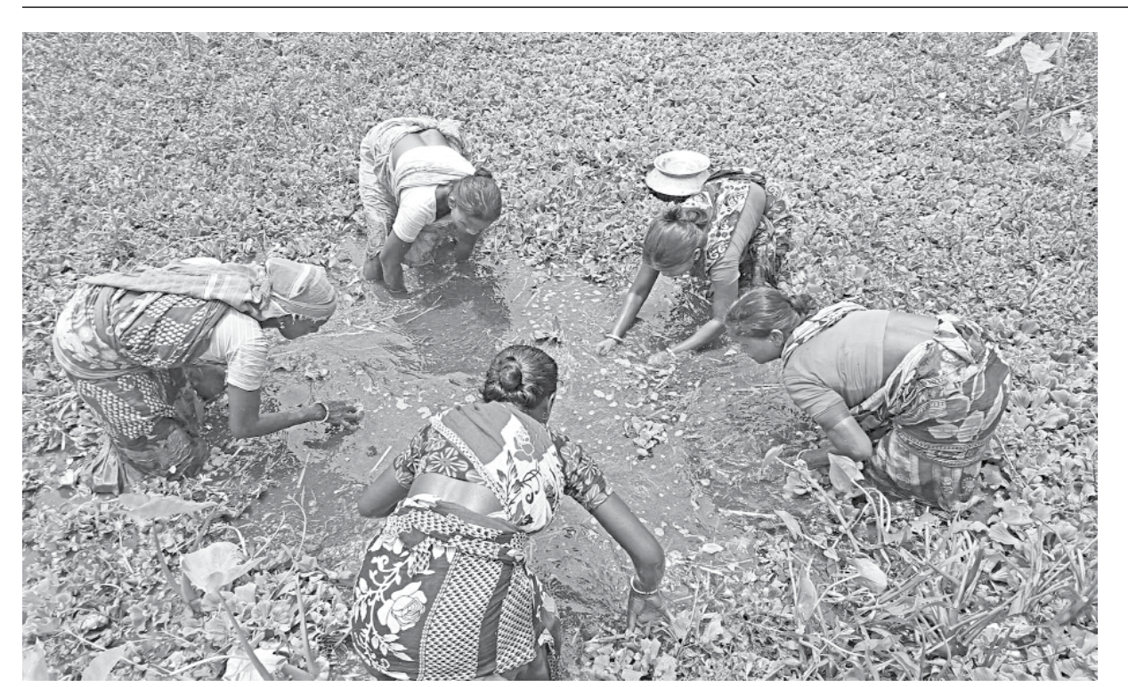
A group of women from the ethnic community are seen busy catching fish at a roadside ditch in Shantinagar area of Joypurhat Sadar upazila. The photo was taken a few days ago.

Upazila Nirbahi Officer Monira Parveen said strict action will be taken after investigating the matter.