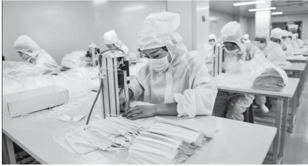
Domestic mask demand has dropped dramatically in China.