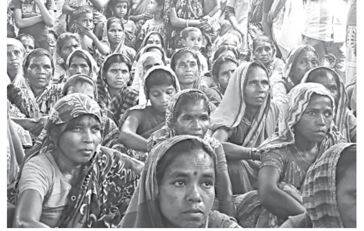
A section of tea workers in Moulvibazar's Kulaura upazila.

He also said that at the meeting he has warned all concerned to return all the money that was collected illegally from the workers. Otherwise, the person responsible will face strict Asked whether the allegation action from the administration.