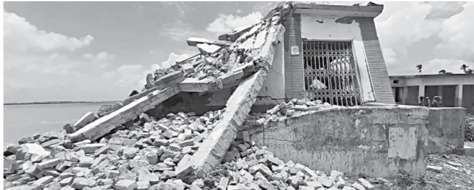
Paisha Majihail Government Primary School at Solimabad in Tangail's Nagarpur lies ravaged due to erosion by the Jamuna river on Sunday. Above, a scene of erosion by the Brahmaputra at Dhanarchar Nutangram village of Jadurchar union in Kurigram's Roumari upazila.