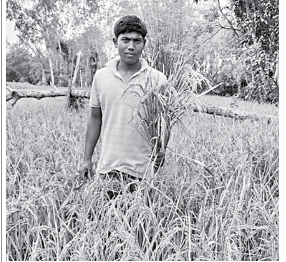
Paddy plants dry out and turn sterile under the impact of toxic smoke emitted from a brick kiln at Nawdabas village in Phulbari upazila of Kurigram.