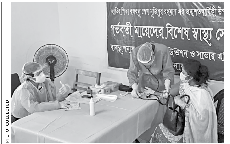
A pregnant woman receives health consultancy and treatment at a daylong free medical camp, organised by 15 East Bengal (Mechanised) of Bangladesh Army, at Sadar Uddin College premises in Manikganj's Shivalaya upazila recently.