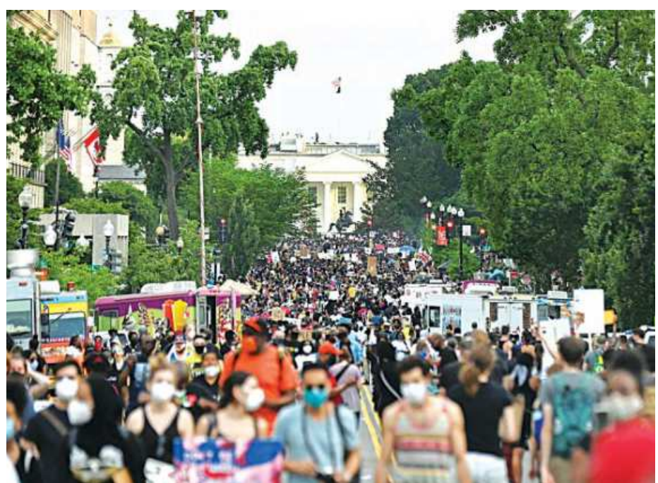
Demonstrators yesterday march on Black Lives Matter Plaza near the White House, during a protest against racial inequality in the aftermath of the death in Minneapolis police custody of George Floyd.