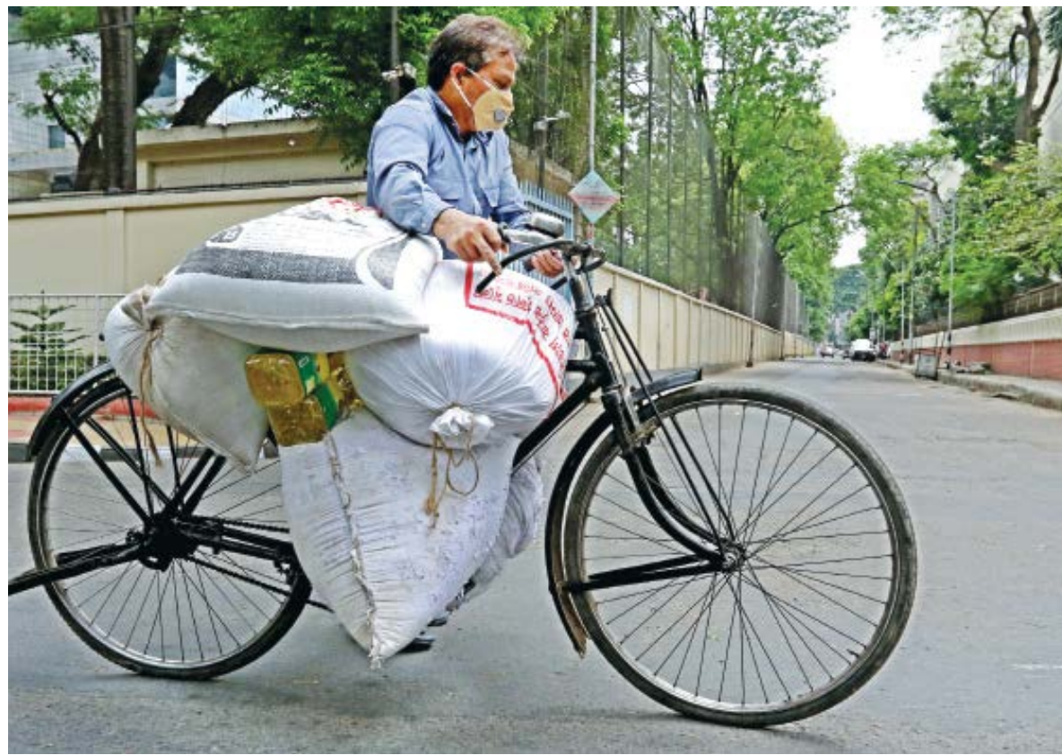
A convenience store owner of Old Dhaka pushes his bicycle loaded with goods bought from Karwan Bazar. Due to restrictions on three-wheelers at some neighbourhoods and streets in the capital, he has to do this laborious task himself. The photo was taken near Matsya Bhaban yesterday.