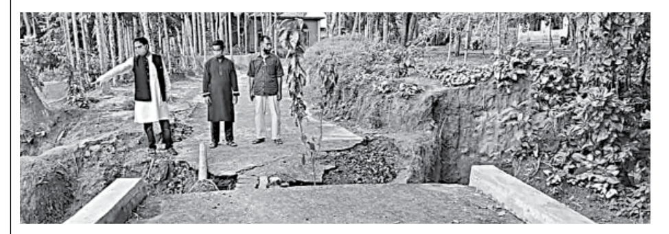
A one kilometer road from Gourangi Uttar Para to Akashi School in Tangail's Ghatail upazila gets damaged within days of its construction.

"The DC has directed us not to release bills of the works until completion of the renovation work of the damaged parts of the