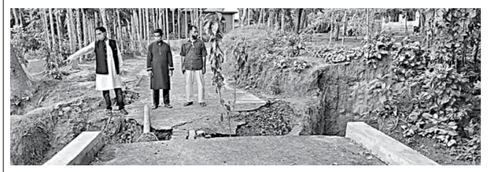
A one kilometer road from Gourangi Uttar Para to Akashi School in Tangail's Ghatail upazila gets damaged within days of its construction.

"The DC has directed us not to release bills of the works until completion of the renovation work of the damaged parts of the