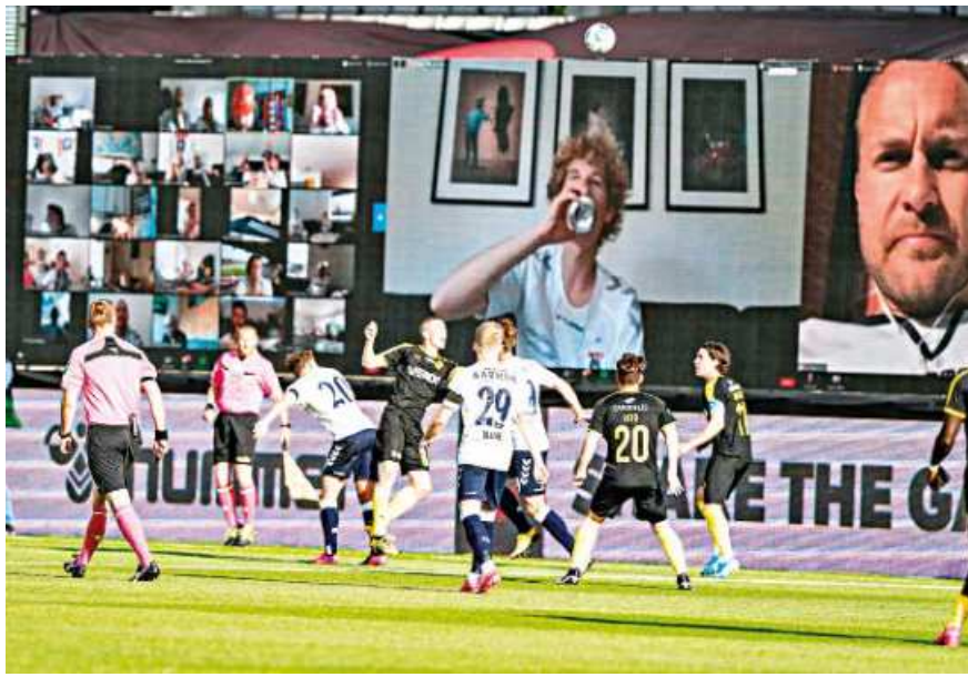
CAPTION 2 3y