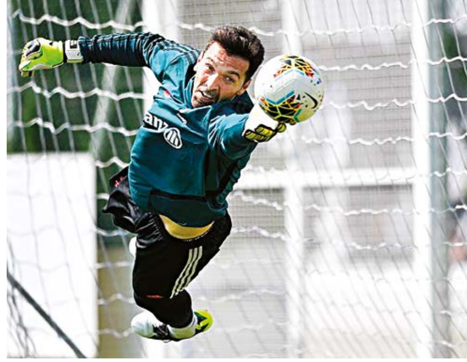
CAPTION 2 3y