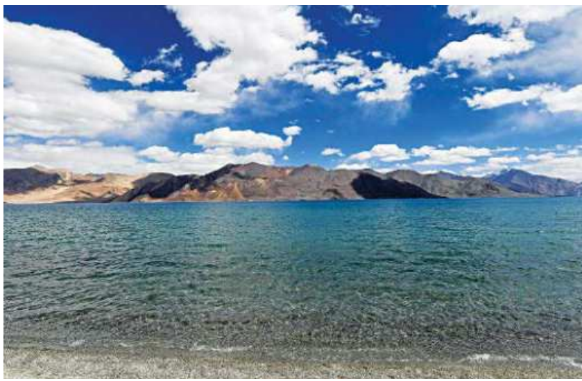
This photo taken on September 14, 2018, shows a general view of the Pangong Lake in Leh district of Union territory of Ladakh bordering India and China.

India and China share 3,488km-long land border, most of which remain disputed. at several points, some reportedly penetrating 3-4km over punishing Himalayan terrain. Many are said to have destroyed Indian posts and bridges, and dug in with tents and trenches. At least 10,000 PLA soldiers are now believed to be camping on what India claims to be its territory - Pangong Tso Lake, Galwan Valley and Demchok in Ladakh, and Nathu La in Sikkim. According to satellite footage published by the Indian news channel NDTV, there has been large-scale construction work at a Chinese military airbase less than 120 miles from the border in recent weeks, including the