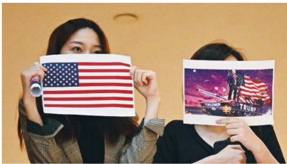
Two women hold up posters of the US flag and a depiction of President Donald Trump during a rally in a shopping mall in Hong Kong yesterday, as the city's legislature debates over a law that bans insulting China's national anthem.