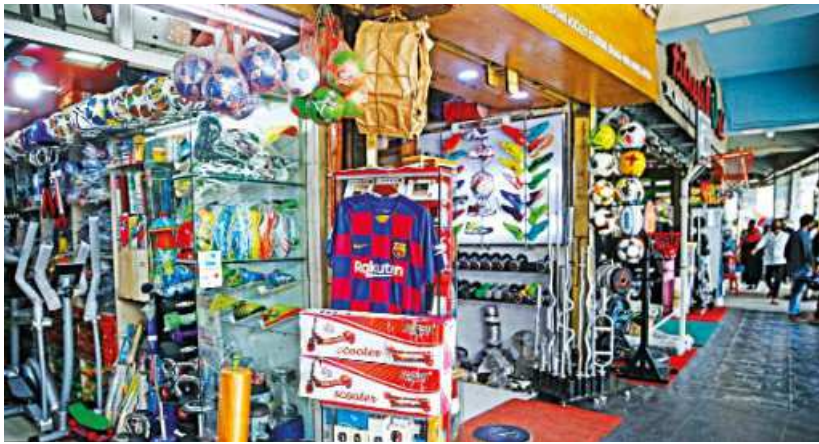
After being closed for more than a month and a half, the Maulana Bhasani Hockey Stadium has been opened as restrictions on businesses around the country are slowly eased. The sports shops are seeing a decent number of customers, but safety measures are apparently very lax.

SPORTS REPORTER Despite easing restrictions on business and social activities amid the extended general vacation, the government is not yet planning to lift restrictions on the country's sporting activities. "At the moment, there is no situation to participate in any competitions or tournaments as sporting activities are suspended. If players contract the virus during practice or training, it can be dangerous," Zahid Ahsan Russel, state minister for youth and sports, told The Daily Star on Thursday. On March 16, the ministry released a circular instructing all national sports