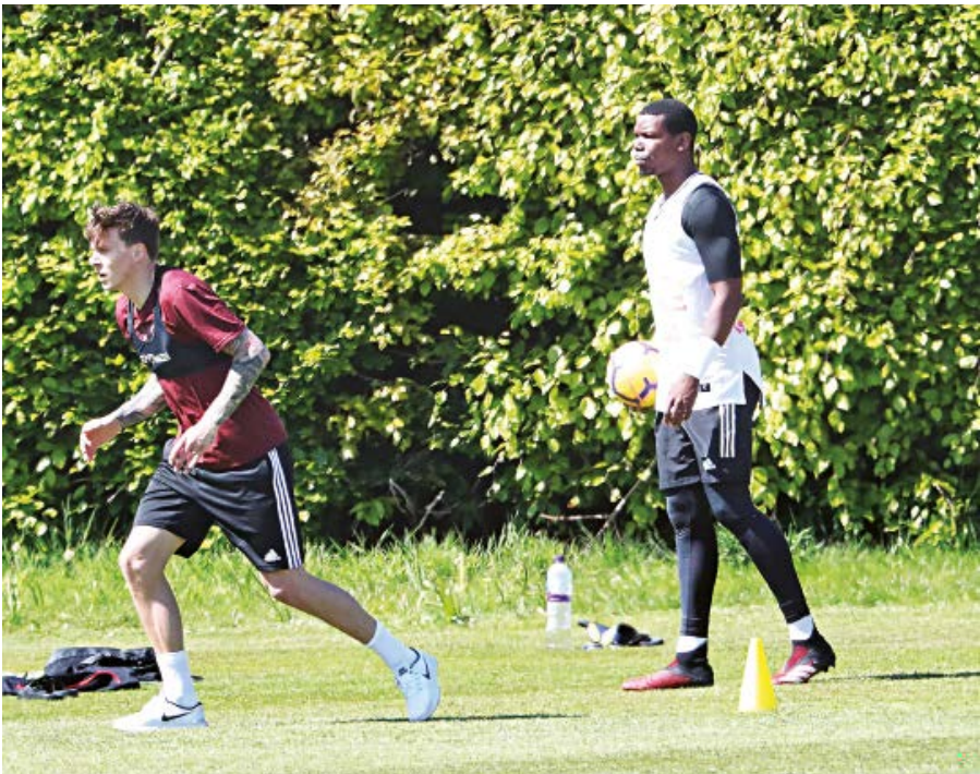
Paul Pogba (R) and some of his Manchester United teammates, including Victor Lindelof (L) and Andreas Pereira, were pictured training for the second time this week at a cricket club in Cheshire yesterday.

federations to suspend activities. Two months since that declaration, there is already disagreement among stakeholders over whether to resume. Most Premier League clubs want the season ended without any more competition but footballers are opposed to that idea. Meanwhile, the Cricket Welfare Association of Bangladesh have demanded the resumption of the