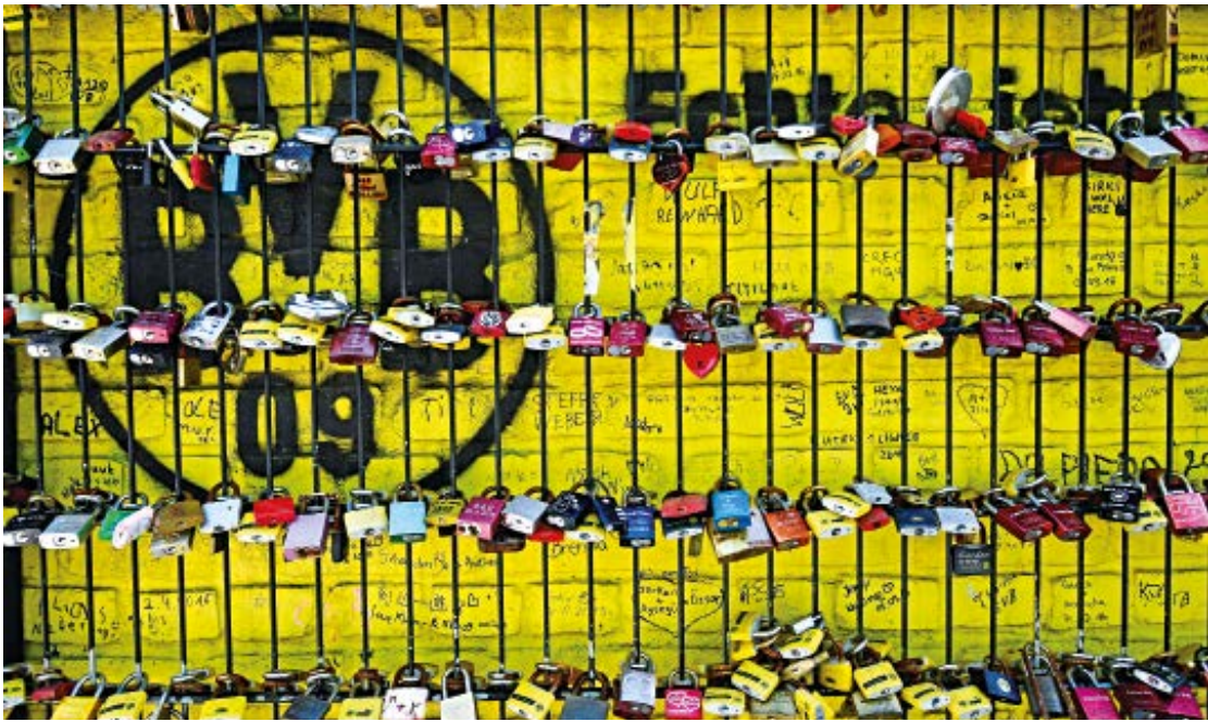
A picture taken on Thursday shows love locks on a fence in front of the Signal Iduna Park, the home of Borussia Dortmund, ahead of the return of the Bundesliga today.

The Bundesliga will be the first major European league to resume when it gets going following a two-month break due to the COVID-19 pandemic. The second tier will also get underway. All matches will be played behind closed doors, and progress will be watched around Europe. Doubts have already surfaced after second tier Dynamo Dresden's entire squad were quarantined by the local health