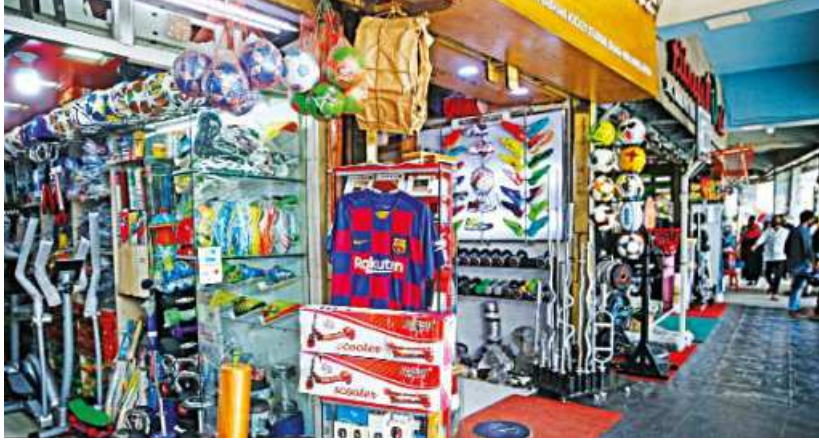
After being closed for more than a month and a half, the Maulana Bhasani Hockey Stadium has been opened as restrictions on businesses around the country are slowly eased. The sports shops are seeing a decent number of customers, but safety measures are apparently very lax.

On March 16, the ministry released a circular instructing all national sports