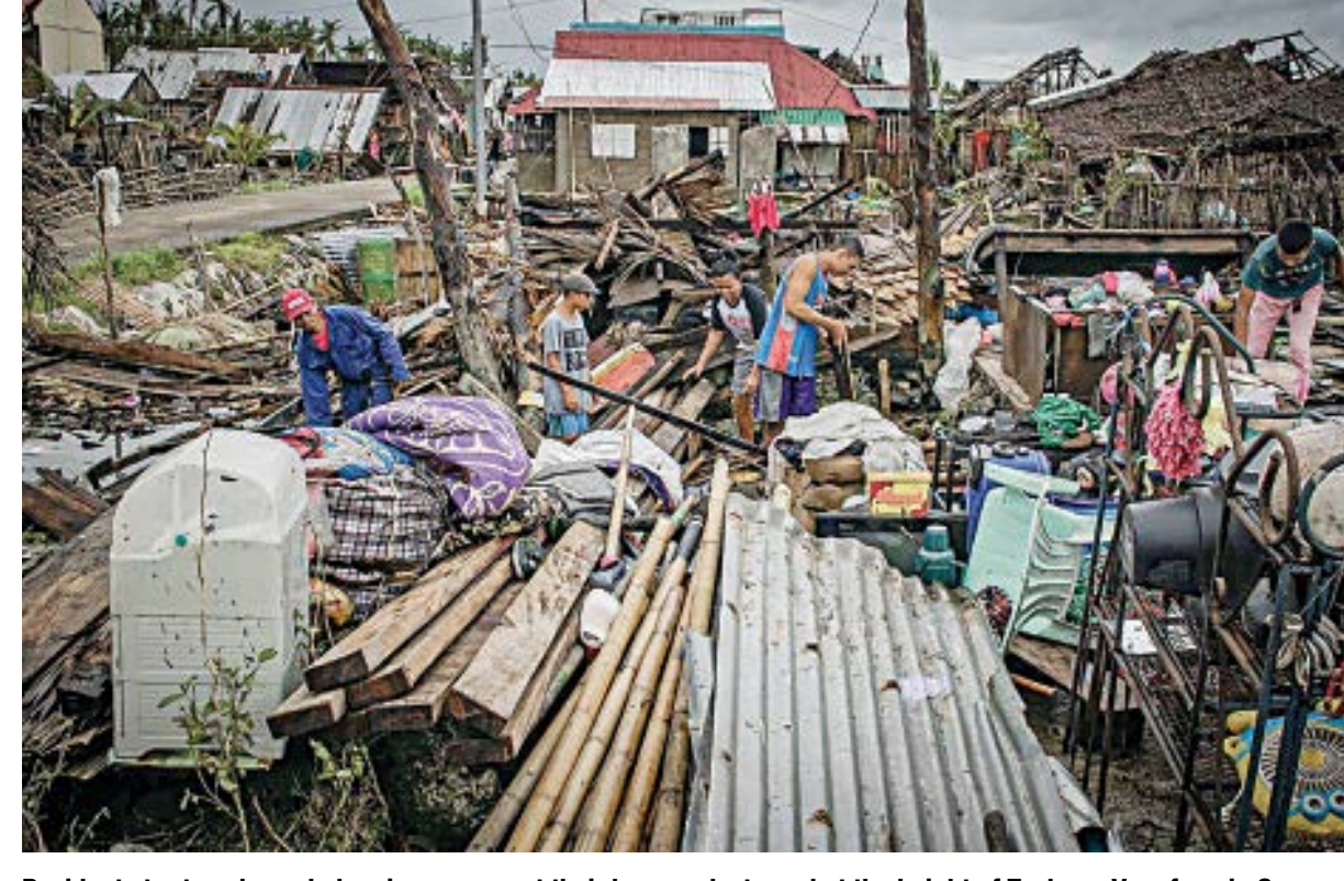
Residents try to salvage belongings amongst their houses destroyed at the height of Typhoon Vongfong in San Policarpio town, Eastern Samar province yesterday, a day after the typhoon hit the town. Tens of thousands of people were forced into cramped shelters by the powerful storm, making social distancing nearly impossible as the nation battles the coronavirus pandemic.