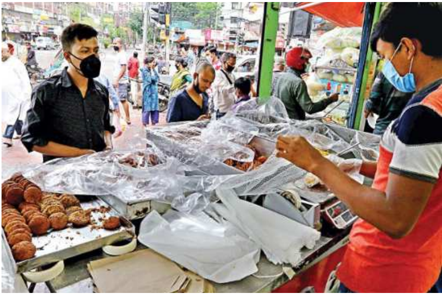
A man sells iftar items at a shop on North South Road in the capital yesterday. Amid the countrywide shutdown, the authorities yesterday allowed restaurants to sell takeaway iftar items maintaining social distancing. Many shops were seen giving hand sanitizers to customers.