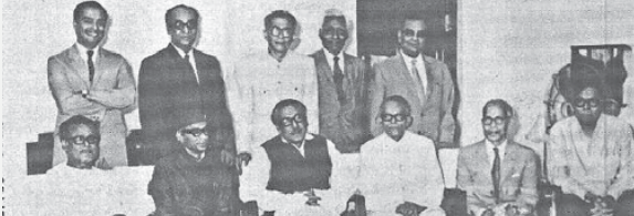
Ministerial delegations on water, power and irrigation from India and Bangladesh call on Bangabandhu at Gonobhaban on April 29, 1972.