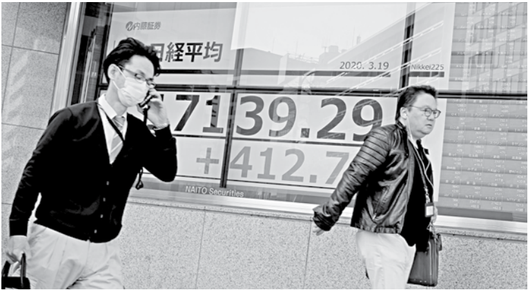
Pedestrians go past a quotation board displaying the share price numbers of the Tokyo Stock Exchange.

Nikkei heavyweight SoftBank Group said it would sell up to $41 billion in assets to finance a stock buyback, reduce debt and increase