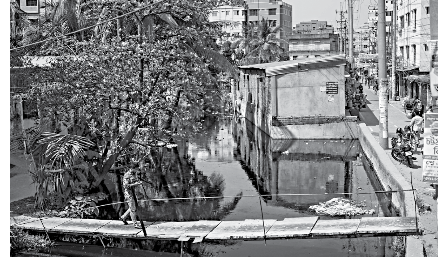
A tin-shed structure has been constructed on Chattogram's Chaktai canal. Transgressions into waterbodies like this have become a regular occurrence across the country. This photo was taken yesterday.