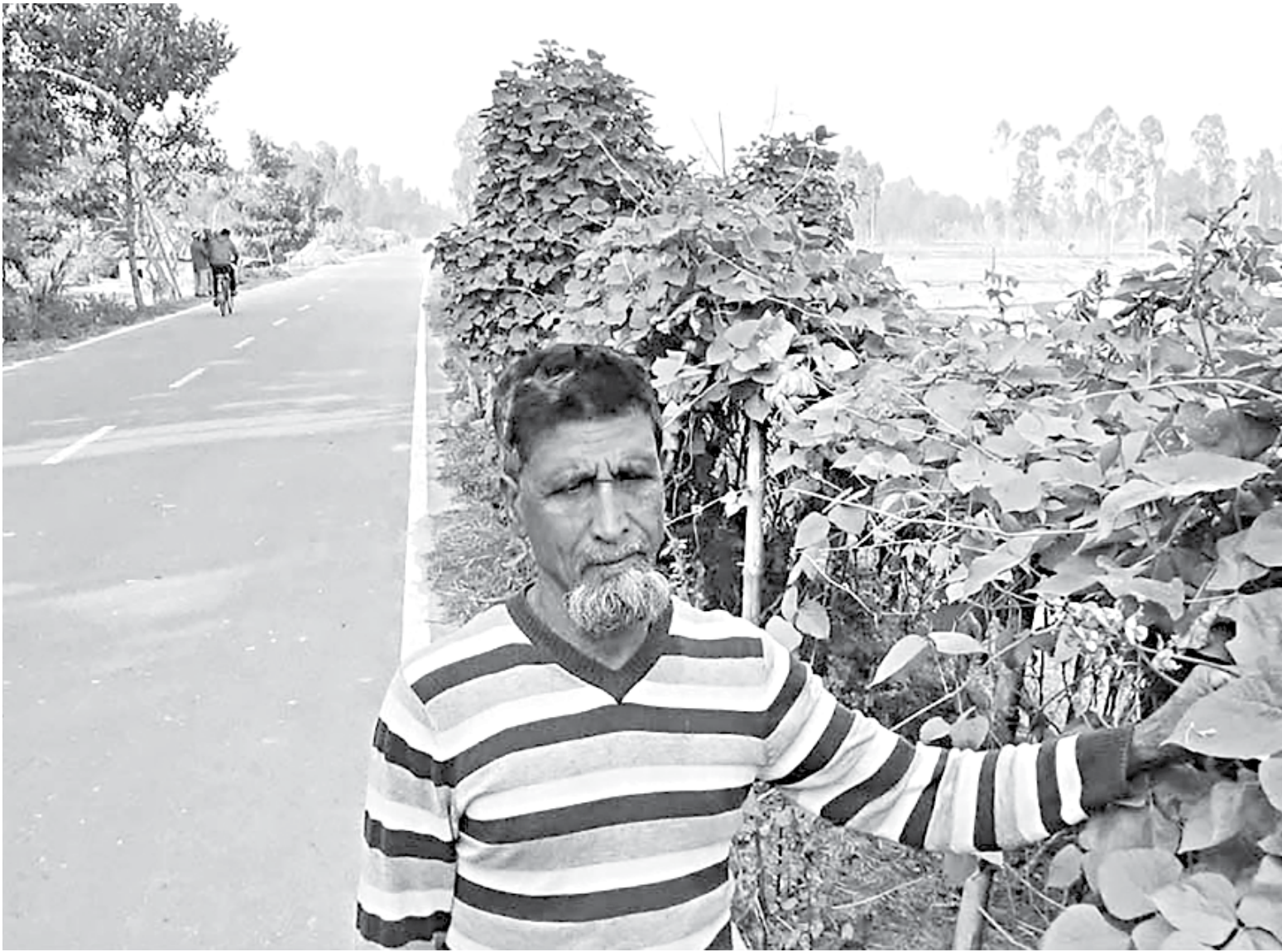
A landless farmer next to his vegetable plants he grew beside a regional highway in Kachus area of Gaibandha's Saghatā upazila.