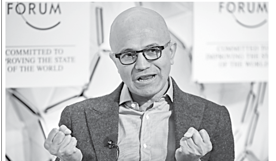
Microsoft CEO Satya Nadella

During a keynote speech earlier, Nadella emphasized the need for businesses to build their own technology at a time digital services are transforming all industries, and