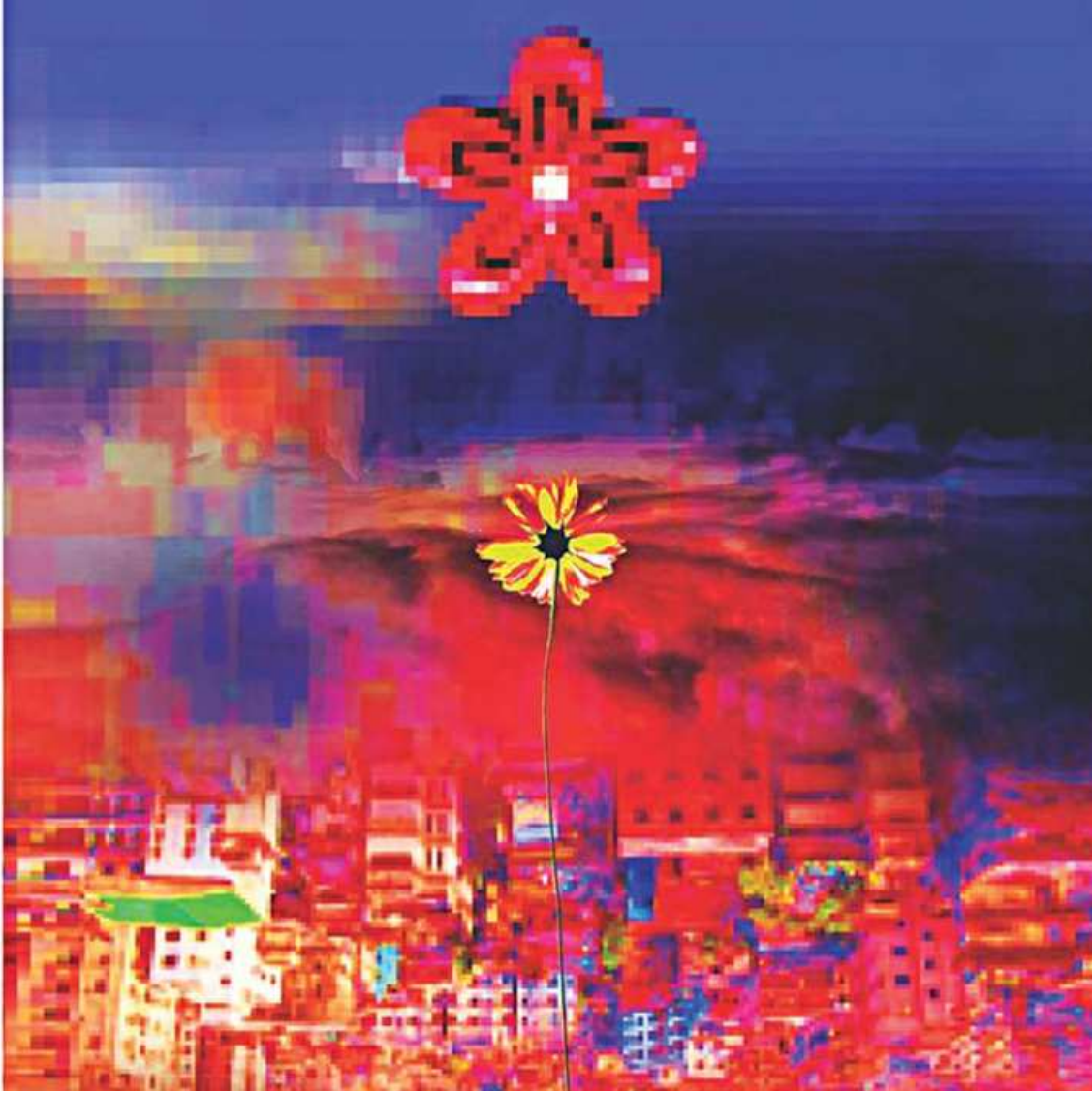
"The biggest freedom in digital art, for me, is how it lets you tweak, adjust, and manipulate images to achieve a multitude of meanings."

DHAKA THURSDAY FEBRUARY 20, 2020, FALGUN 7, 1426 BS