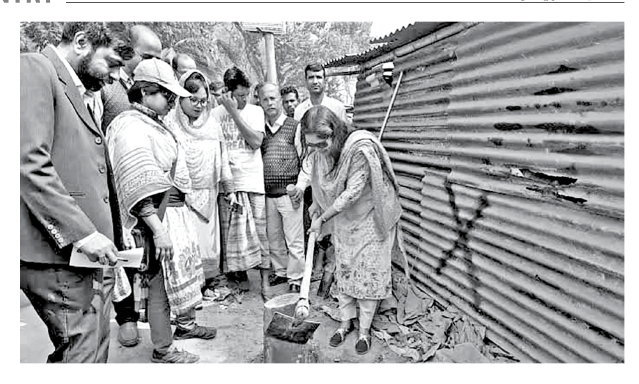
Tangail district administration yesterday started placing demarcation pillars along the Louhajang river in Tangail municipality area. They also marked illegal establishments with red 'cross' marks. The demarcation work will continue till February 21 and removal of illegal structures will start on February 23.

Kohinur later drowned the newborn in water of a bucket and fled the scene.