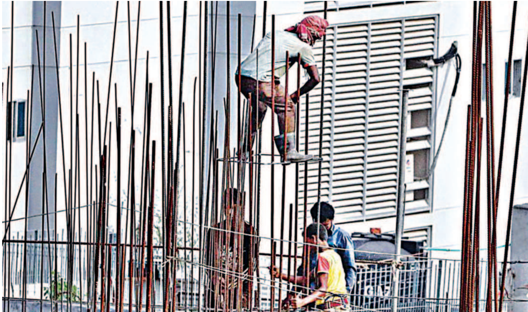
A construction worker stands on a frame of a pillar with sharp iron rods all around him.

There is certainly a lot of innovation going on, and it takes many different forms in the informal sector. For the metalworkers in Bangladesh, it is often a case of reverse engineering products sold by formal businesses and working out how to make cheaper alternatives from available materials. But there is also some brilliant high-end creative work. The informal manufacturers are innovative not only in terms of new products they come up with but also in the way they market those products—through attractive, distinctive packaging and other types of branding.