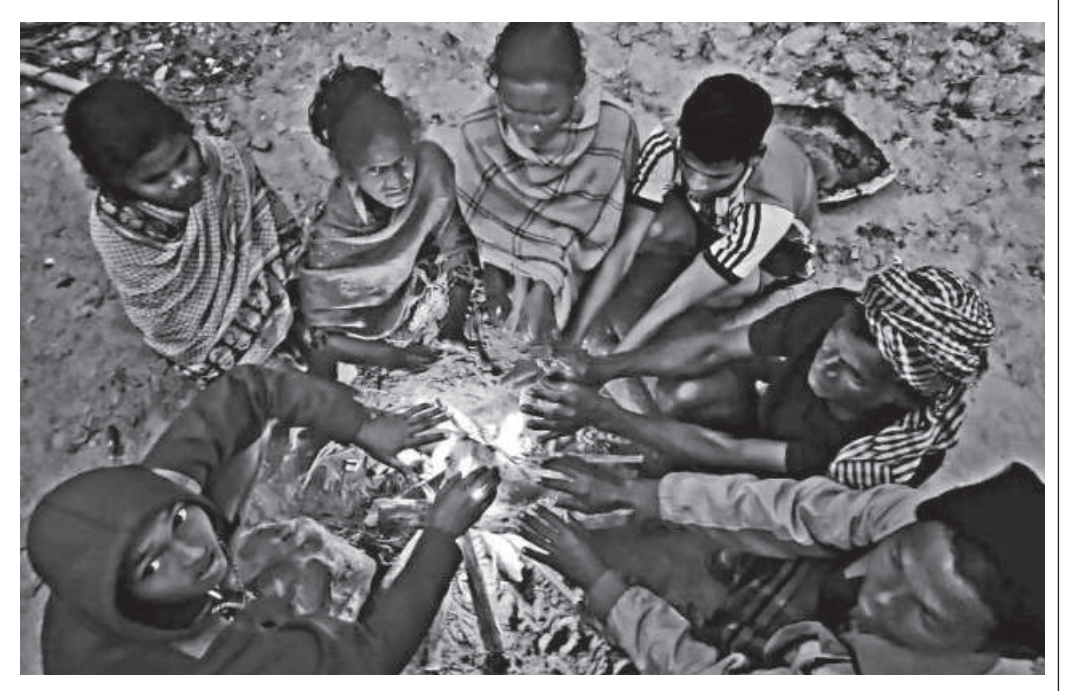
Tea workers sit around a fire in Lakhai tea garden of Moulvibazar's Sreemangal upazila to get warmth in the bone-chilling cold.