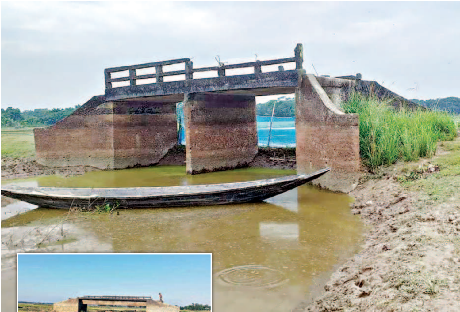
The bridge in Baradal village of Moulvibazar's Kulaura upazila has been of no use for 23 years as there is no approach road on either side. The bridge was built in 1997 with a cost of Tk 5 lakh. Inset, another bridge in the same union, built in the same year, has no approach roads either.