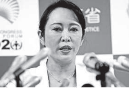
Japan's Justice Minister Masako Mori

Japanese officials on Sunday broke days of silence about the Ghosn case, saying they would tighten immigration measures and promising a thorough investigation. Authorities have also issued an international notice for his arrest. All government offices and most businesses in Japan have been shut for the New Year holidays, which formally ended on Monday.