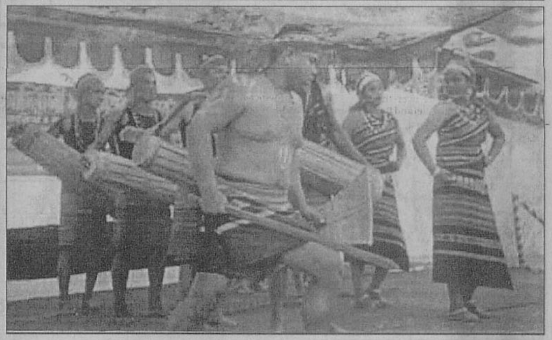
Indigenous Garo people presenting a dance at a festival held at Birishiri Tribal Cultural Academy in Natrakona on Thursday welcoming the rainy season.