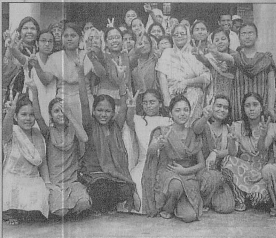
A galaxy of stars...Jubilant GPA-5 scorers at Blue Bird High School in Sylhet (left) and Barisal Government Girls High School along with their teachers after publication of SSC examination results.