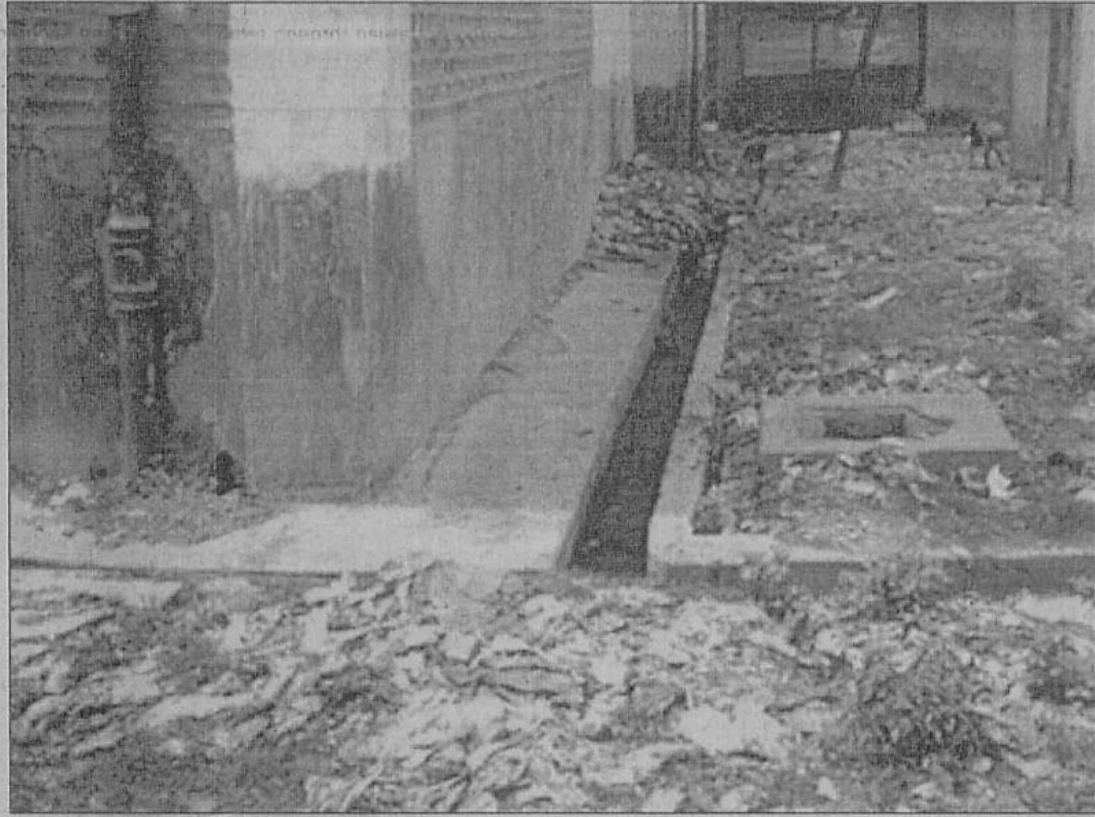
Medical waste littered on a hospital compound in Dinajpur town.